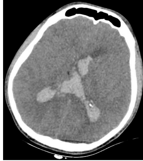
Şekil 1. Serebral BT; yaygın ventrikül içi kanama

ventriküler drenaj (EVD) takılmış olarak çocuk yoğun bakım ünitesi (ÇYBÜ)'ne kabul edildi.