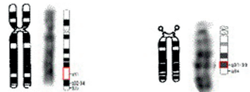
der (4), t(4;13) (q31.3;q33)