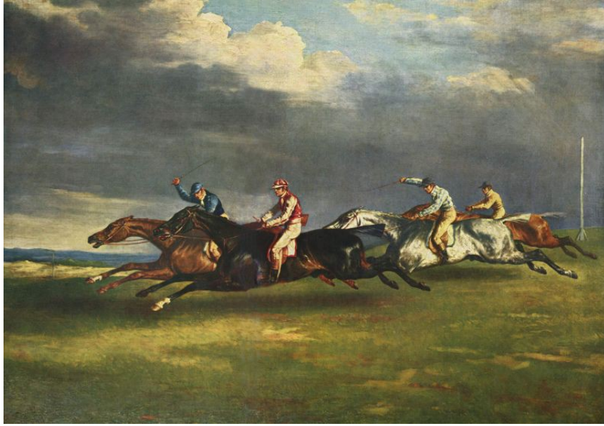
Resim 1. Theodore Gericault, Epsom At Yarışları, 1821

olursak, yaşanan gelişmeler sanat akımları doğrultusunda gerçekleşmiştir. Theodore Gericault'nun Epsom At Yarışları (1821) bu konuda örnek gösterilebilir (Resim 1). Bunun yanında yine Edward Muybridge'in Dörtnala Koşan Atlar (Resim 2) adlı çalışması göstermiştir ki "Bu tarihten elli yıl kadar sonra fotoğraf makinesi, hızla hareket eden atları anında tespit edecek yetkinliğe ulaşınca, hem ressamların, hem de seyircilerin yanıldıkları çıktı ortaya" (Gombrich, 1992: 10).