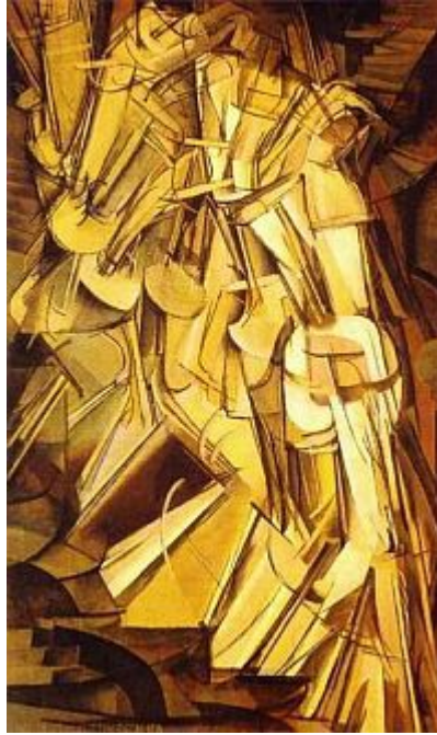
Resim 3. Merdivenden İnen Çıplak, Marcel Duchamp, 1912

Konuyu biraz daha açıklığa kavuşturmak anlamında bir başka örnek olarak da resim sanatından Marcel Duchamp’ın ‘Merdivenden İnen Çıplak’ adlı resmini vermek istiyoruz.