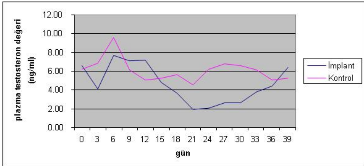
Şekil 1. Deslorelin ve kontrol gruplarında plazma testosteron konsantrasyonlarının zamana bağlı olarak değişimi (n=6) Fig 1. Change according to time of plasma testosterone concentration in deslorelin and control groups (n=6)

Deslorelin grubunda testis hacmi, uzunluğu, çapı, çevresi ve epididimal ölçüler açısından en düşük ve en yüksek değerler sırasıyla, 391.7±10.3 ml, 17.0±2.2 cm, 2.5±0.5 cm, 0.56±0.09 mm ve 557.5±136.9 ml, 18.3±2.3 cm, 3.1±0.5 cm, 29.2±2.4 cm, 0.89±0.08 mm olarak tespit edilmiştir. Kontrol grubunda ise söz konusu parametreler için en düşük ve en yüksek değerler sırasıyla, 411.2±79.9 ml, 17.0±1.5 cm, 2.1±0.4 cm, 27.4±2.1 cm, 0.64±0.03 mm ve 415.5±82.3 ml, 17.5±2.0 cm, 17.5±1.5 cm, 2.4±0.3 cm, 2.3±0.4 cm, 28.0±2.2 cm, 0.65±0.1 mm olarak elde edilmiştir. Deslorelin grubunda sadece testis hacmi değerlerinde zamana bağlı olarak sürekli bir azalma olduğu, diğer bütün parametreler açısından ise gerek implant grubu, gerekse kontrol grubunda birbirine yakın değerlerin ortaya çıktığı belirlenmiştir. Testis hacmi, uzunluğu, çapı, çevresi ve epididimal ölçüm değerleri açısından gruplar arasında istatistiksel olarak fark olmadığı saptanmıştır (P>0.05; Tablo 2).