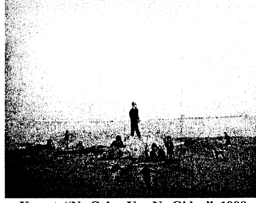
Komet, “Ne Gelen Var Ne Giden”, 1998, Tuval Üzerine Yağlıboya.

Yaratma sürecinde “geçen zaman” üzerinden belirleyici olan ise yaratıcının hangi zaman dilimiyle ilişkide olduğudur. Komet’te zaman kendi deyişimiyle “idi/idim/idik” katmanlarından oluşmaktadır [4]. Bunu da Komet’in içinde olunan zamanı yaşamak ve bu “an” ın farkında olmak tanımlamasıyla anlamlandırdığı düşünülmektedir. Zamana dair yapılan bu atıflar bir kavram olarak ele alındıklarında yaşamın kendisi olduğu gerçeğiyle karşılaştırır bizi. Ki bunlar aynı zamanda yaşamın içinde var olan olgular olarak resimde karşılık bulur. Sanatçı için şimdiki zamanın aurasının farkında olmak zamanın ruhunu belirleyen bir edimdir. Renkler, çizgiler, boşluklar nesnelere birbirleriyle olan ilişkileri ve ilişki/sizlik/leri bir sanat yapısında bulunması muhtemel olan diğer unsurların her biri, kendi başına zamanı içine alan yapıdadırlar. Burada zaman donmuştur. Sunulmuş imge yaşamdan bir sahneye benzer tıpkı Komet’in resimlerinde olduğu gibi... Üretim tamamlanıp varlığını sürdürdüğü sanatçının yaşamının ötesine geçer.