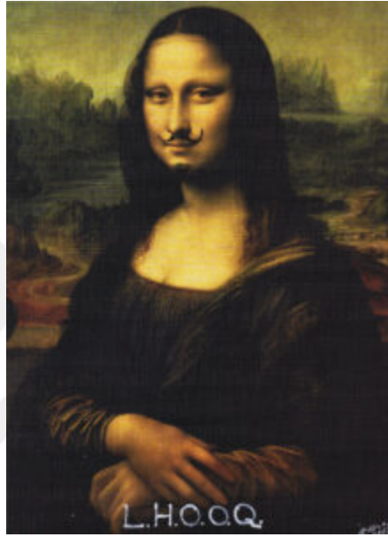
Şekil 3.3. LHOOQ, M. Duchamp, 1920.