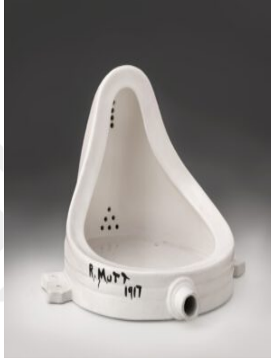
Şekil 3.4. Fountain, M. Duchamp, 1917.

sanatçılara ilham olmuştu. Lakin birçok insan için rahatsız edici anılar taşımaktaydı. Burası 1871 Paris Komünü ayaklanması sırasında sokağa dökülen halkın katledildiği yerdi. Housefield'ın haklılığı iki eser yan yana konulduğunda anlaşılır. Pisuar'ın yuvarlak formlarının bazilikaninkini andırdığı söyleyebilir. Ayrıca Duchamp eserin kaybolan orijinalini atölyesinde tavan hizasına montelemiştir. Bunun nedeni bazilikanın yüksek bir tepenin üzerine kurulmasına atıfta bulunmaktı (Yıldız, 2016).