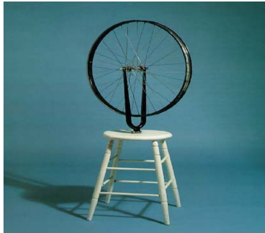
Şekil 3.2. Bicycle Wheel, M. Duchamp,1913

Bicycle Wheel Fransa'nın devasa Eyfel Kulesinin eleştirisiydi. En alttaki küp Paris'i, üzerindeki tabure Eyfel Kulesini, bisiklet tekerleği ise o zamanlarda Eyfel Kulesinin bir kartpostalında görülen dönme dolabı simgeliyordu. İktidarın kendini yeniden üretmesi olarak nitelendirdiği Eyfel Kulesini, "ready made" (hazır nesne) kullanarak yaptığı eserde eleştiriyordu. Bundan bir yıl sonra, 1914'te dökme demirden yaptığı "Bottle Rack" (Şişe Askılığı) adlı eserinde ise Eyfel Kulesinin çirkinliğini anlatmak istiyordu (Yıldız, 2016).