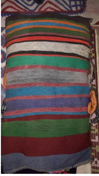
Fotoğraf 2-Kirmenli Çuval 70x1,15 (SarıkeçiliYörükleri KerimKARADAYI'nın çadırı)

2.2.Topakyanışlı Çuval: 2,1 -2,1 atlamalar ile cicim tekniğinde dokunur. Topakyanış motifi (akrep motifi) olması nedeni ile Topakyanışlı çuval diye isimlendirilir.Motif yanlara doğru bir tel kaydırmak suretiyle oluşturulur desenin tam ortasında baklava şeklindeki bölümlerde "boncuk" denilen motifler yer alır. Topakyanış motifleri çuval yüzeyine enlemesine yan yana 3 boyuna da 4 sıra olacak şekilde yerleştirilmiştir. Yüze yerleştirilen Topakyanış motifleri kompozisyonunu alaboncuk adı verilen şerit çuvalı enlemesine paftalara ayırmıştır. Çuvalın arka yüzü bezayağı tekniğinde ve motiflerde kullanılan renklerle şerit halinde düz bir şekilde dokunmuştur. Çuvalın kenar kısımlarında 5cm eninde kolon dokumalardan kulplar oluşturulmuş olup buna sarı keçililer "Katibi" adı vermişlerdir.