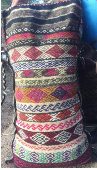
Fotoğraf 5-Alaca Çuval 70x1,17 (SarıkeçiliYörükleri KerimKARADAYI'nın çadırı)

2.5. Sandıklı Çuval: 2,1 -2,1 atlamalar ile cicim tekniğinde dokunur. Dokuma üzerinde bulunan akrep motiflerinin etrafındaki kare şeklindeki motiflerle çevrili olması nedeni ile Sandıklı çul olarak isimlendirilmiştir. (Emine KARADAYI 2016 Aralık ) Akrep motifleri ve sandık motilerini şeritler halinde bir birinden ayıran Pıtrak motifleri desenleri kesin hatlarla bölerken yine şeritler halinde bezayağı zemin üzerindeki koçboynuzu motifleri dikkati çeker. Çuvalın ağız kısmına yakın bölümlerde seyrek motifli cicim dokuma tekniği uygulanmış olup ağız kısmı tamamen siyah renkli bezayağı şeklinde dokunmuştur. Çuvalın arka yüzünebezayağı tekniğinde atkı ve çözgüleri tamamen kıldan siyah renkte düz bir şekilde dokunmuştur. Çuvalın kenar kısımlarında 5cm eninde kolon dokumalardan kulplar oluşturulmuş olup kolonların uçları saç örgü tekniğinde örülmüştür. Kolon dokumalara Sarı keçililer ‘‘Katibi’’ adı vermişlerdir.