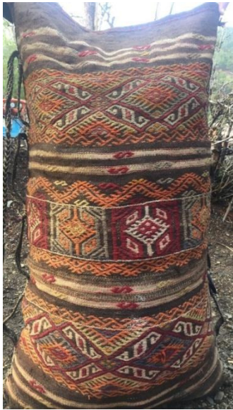
Fotoğraf 6-Sandıklı Çuval 70x1,15 (Sarıkeçili Yörükleri Kerim KARADAYI'nın çadırı)

2.5. Sandıklı Çuval: 2,1 -2,1 atlamalar ile cicim tekniğinde dokunur. Dokuma üzerinde bulunan akrep motiflerinin etrafındaki kare şeklindeki motiflerle çevrili olması nedeni ile Sandıklı çul olarak isimlendirilmiştir. (Emine KARADAYI 2016 Aralık ) Akrep motifleri ve sandık motilerini şeritler halinde bir birinden ayıran Pıtrak motifleri desenleri kesin hatlarla bölerken yine şeritler halinde bezayağı zemin üzerindeki koçboynuzu motifleri dikkati çeker. Çuvalın ağız kısmına yakın bölümlerde seyrek motifli cicim dokuma tekniği uygulanmış olup ağız kısmı tamamen siyah renkli bezayağı şeklinde dokunmuştur. Çuvalın arka yüzünebezayağı tekniğinde atkı ve çözgüleri tamamen kıldan siyah renkte düz bir şekilde dokunmuştur. Çuvalın kenar kısımlarında 5cm eninde kolon dokumalardan kulplar oluşturulmuş olup kolonların uçları saç örgü tekniğinde örülmüştür. Kolon dokumalara Sarı keçililer ‘‘Katibi’’ adı vermişlerdir.