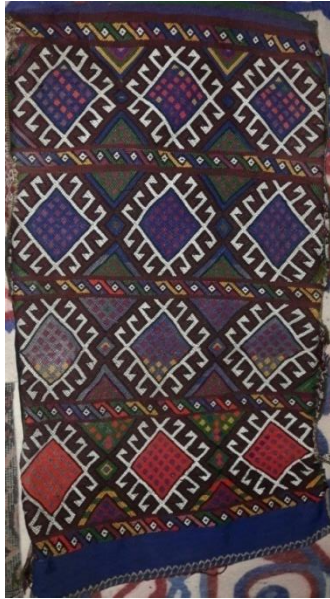
Fotoğraf 3-Topakyanışlı Çuval 70x1,10 (SarıkeçiliYörükleri KerimKARADAYI'nın çadırı)

2.2.Topakyanışlı Çuval: 2,1 -2,1 atlamalar ile cicim tekniğinde dokunur. Topakyanış motifi (akrep motifi) olması nedeni ile Topakyanışlı çuval diye isimlendirilir.Motif yanlara doğru bir tel kaydırmak suretiyle oluşturulur desenin tam ortasında baklava şeklindeki bölümlerde "boncuk" denilen motifler yer alır. Topakyanış motifleri çuval yüzeyine enlemesine yan yana 3 boyuna da 4 sıra olacak şekilde yerleştirilmiştir. Yüze yerleştirilen Topakyanış motifleri kompozisyonunu alaboncuk adı verilen şerit çuvalı enlemesine paftalara ayırmıştır. Çuvalın arka yüzü bezayağı tekniğinde ve motiflerde kullanılan renklerle şerit halinde düz bir şekilde dokunmuştur. Çuvalın kenar kısımlarında 5cm eninde kolon dokumalardan kulplar oluşturulmuş olup buna sarı keçililer "Katibi" adı vermişlerdir.