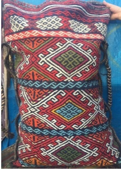
Fotoğraf 4-Topkanyanlı Çuval 70x1,10 (SarıkeçiliYörükleri KerimKARADAYI'nın çadırı)

2.3.Koçboynuzlu Çuval: 2,1 -2,1 atlamalar ile cicim tekniğinde dokunur. Koçboynuzu motifi olması nedeni ile Koçboynuzlu çuval diye isimlendirilir.Motif yanlara doğru bir tel kaydırmak suretiyle oluşturulur desenin tam ortasında baklava şeklindeki bölümlerde yine koçboynuzu motifleri yer alır. Koçboynuzu motifleri çuval yüzeyine enlemesine kenar kısımlarda yarım koçboynuzu motifi, ortalarda bir büyük koç boynuzu olacak şekilde yerleştirilmiş olup boyuna da 3 sıra olacak şekilde yerleştirilmiştir. Yüzeye yerleştirilen Koçboynuzu motifleri kompozisyonunu Kariboşatan adı verilen şerit çuvalı enlemesine paftalara ayırmıştır. Çuvalın ağız kısmında yine koçboynuzu motiflerinin biraz daha küçük hali 4 lü sıra halinde yan yana dokunmuş olup bunu çuvalın ağız kısmını oluşturan renkli şeritler halindeki bezayağı dokuma takip eder. Çuvalın arka yüzü bezayağı tekniğinde ve motiflerde kullanılan renklerle şerit halinde düz bir şekilde dokunmuştur. Çuvalın kenar kısımlarında 5cm eninde kolon dokumalardan kulplar oluşturulmuş olup buna sarı keçililer "Katibi" adı vermişlerdir.