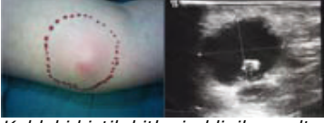
Koldaki kistik kitlenin klinik ve ultrasonografik görünümü