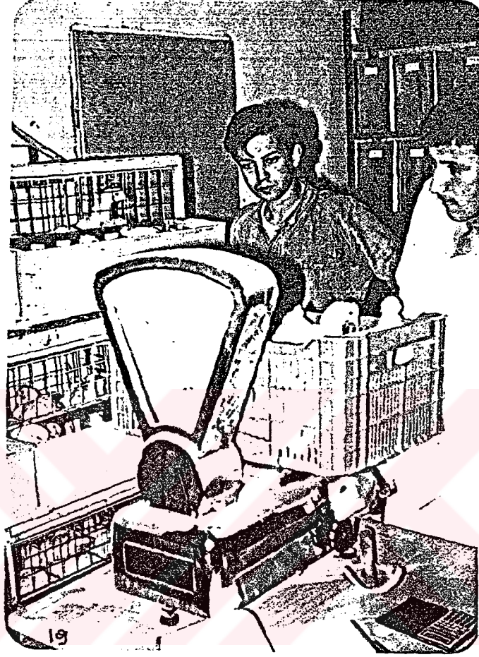
Resim-2 Piliçlerin Tartımı