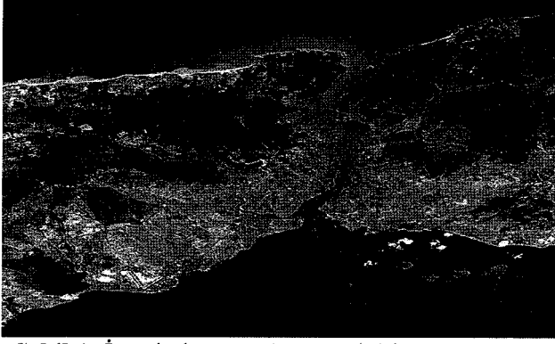
Şekil 1: İstanbul Boğazı'nın Uydu'dan Görünümü

Karadeniz ve Akdeniz seviye ve tuz bakımından farklı olduğu için söz konusu iki deniz arasında İstanbul Boğazı'nda birbirlerine ters yönde ilerleyen yüzey ve dip akıntıları olmak üzere altlı üstlü iki tabakalı akıntı sisteminin olduğu görülmekte olup zaman zaman hızı saatte 7-8 knota (1 knot saatte 1 mil yol) ulaşmaktadır. Yüzey akıntıları Boğazın orta çizgisini izler, ana akıntı burunlara çarparak ve koylara girerek anaför oluştururlar. İstanbul Boğazı'nda az tuzlu ve yoğun olmayan yüzey suları, Karadeniz'den İstanbul Boğazı, Marmara Denizi ve Çanakkale Boğazı yolunu takip ederek, Ege Denizi'ne doğru akar; çok tuzlu, yoğun ve deniz yüzeyinin 10 m. altında bulunan dip suları, tam ters yönde Karadeniz'e doğru ilerler. Akıntı üstten Çanakkale'ye, alttan Karadeniz'e doğru akar (Gültepe, 1998: 8-46). Dip akıntısının sürati Marmara Denizi'nden Boğaza girişte yaklaşık 1 knot iken, Karadeniz çıkışında yaklaşık 2 knot'dır (Güler ve Poyraz, 1997: 535-541). İstanbul Boğazı'nda Karadeniz'den Marmara'ya doğru olan yüzey akıntısı şiddeti lodos rüzgarlarında Marmara'dan Karadeniz'e doğru dönebilmekte olup bu akıntıya orkoz adı verilmektedir. İstanbul Boğazı'nda yıl boyunca hakim rüzgar Kuzey Kuzey Doğu (Nort-North-East (NNE)) ve Kuzey olup en şiddetli estikleri zaman Sonbahar ve kış aylarıdır (Çetin, 1999: 6).