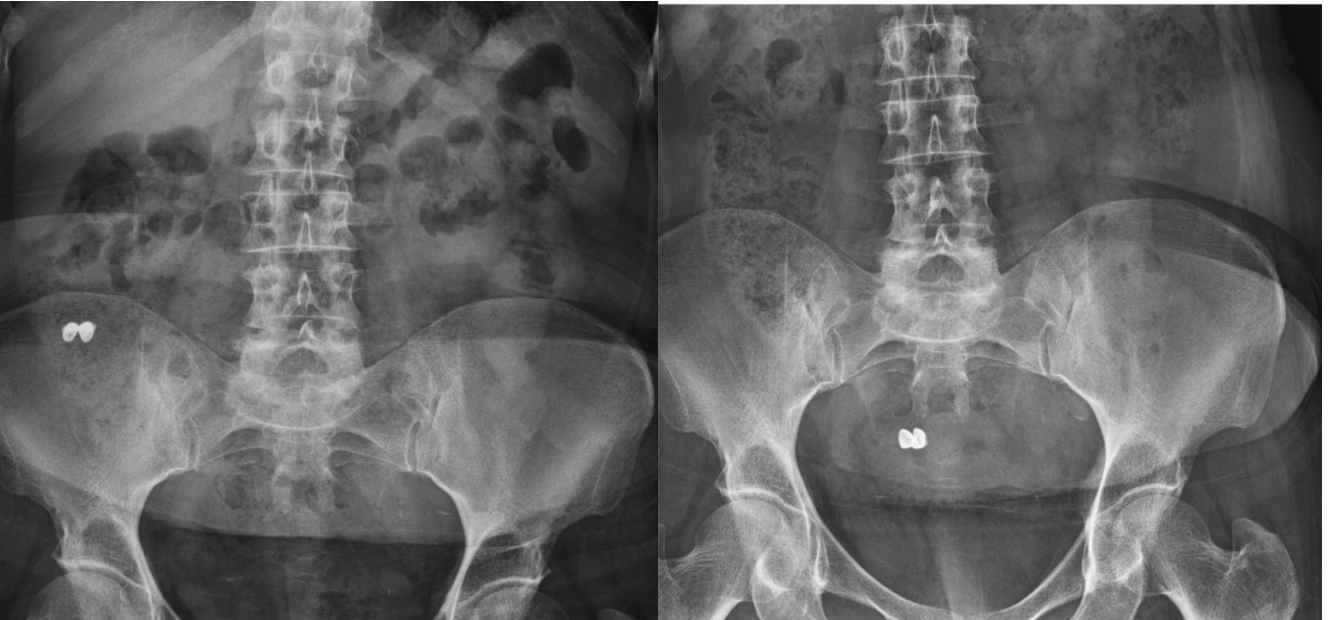
Resim 3. Direkt grafilerde yutulmuş diş protezleri ve takipleri görülüyor