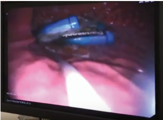
Resim 4. Mideden snare ile yakalanıp çıkarılan piller

Özofagustan yabancı cisim çıkarılmış hastalarımızı takiben incelediğimizde birinde özofagal web, ikisinde akalazyaya, birinde özofagus kanseri ve birinde de geçirilmiş