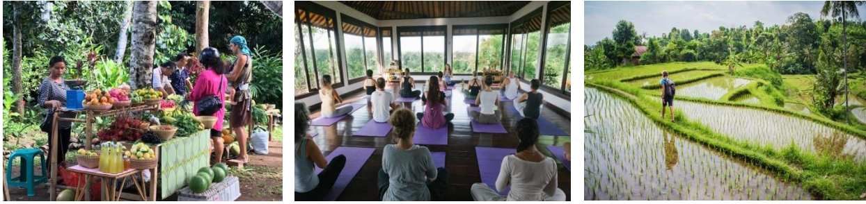
Görsel 1. Ubud Bali'de Yapılan Ye, Dua Et, Sev Tur Görselleri (Get your Guide, 2022; Viator, 2022).

film çekilmiş ve Elizabeth Gilbert rolünde Julia Roberts yer almıştır (William, 2011: 1). Kitabın filme uyarlanmasının ardından kitap satışlarının 10 milyonu geçtiği belirtilmiştir (Sawyer, 2015). Ayrıca filmin yayımlanmasının hemen ardından, filmde yer alan unsurları (çaylar, tespihler, yoga malzemeleri vb.) ve tapınak ziyaretlerini de içeren çeşitli yerel ve uluslararası turlar düzenlenmeye başlanmıştır (William, 2011; Park 2018). Böylelikle bireyin içsel yolculuğu ve ruhani dönüşümüne ilişkin ayak izleri, aynı seyahati deneyimlemek isteyen potansiyel turistler için bir hedef olurken, Bali'nin bir destinasyon olarak kimliğini “spiritüel turizm destinasyonu” (Badone, 2016: 42) ve “film turizmi” destinasyonu (Kim, Suri ve Park, 2018: 136) olarak şekillendirmiştir. Bir turizm destinasyonu olarak Ubud'un (Bali-Endonezya) edinmiş olduğu kimlik, % 400 dolaylarında turist artışına neden olmuştur (Bell, 2019: 74). Dolayısıyla içsel yolculuk için çıkılan seyahat, sadece turist kendisinin değil, destinasyonun da değişmesi, dönüşmesini ve gelişmesini tetiklemiştir (Park, 2018: 111).