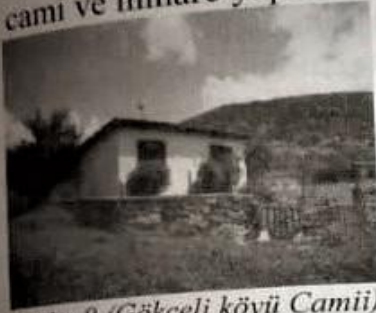
Resim-9 (Gökçeli köyü Camii)