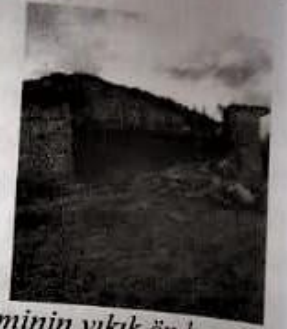
Resim-23(Durlobosu köyü) Resim-24(Durlobosu köyü camii) Resim-25(Caminin yıkık ön kısmı) yer