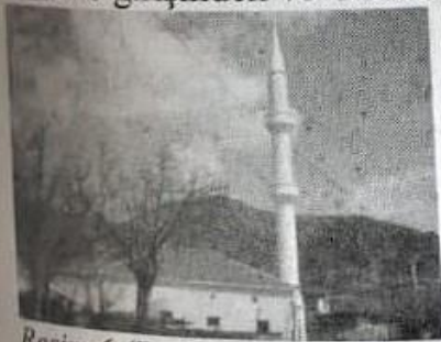
Resim-6 (Dedeli köyü Cami)