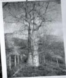
Resim-20 - 21 (Pırstan köyü camii) Resim-22( Camii bahçesi- çınar)