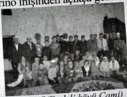
Resim-7 (Dedeli köyü Cami)