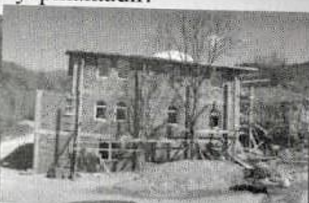
Resim-16ve 17 Bahçebozu cami inşaatı