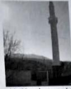
Resim-18 (Kurthamzalı köyü) Resim-19(Kurthamza köyü camii)