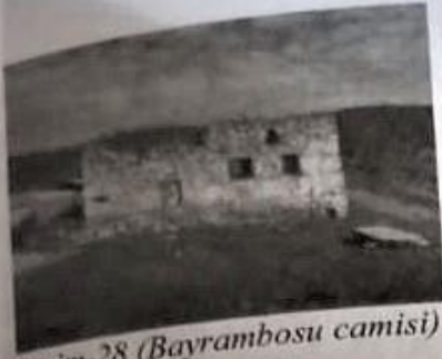
Resim-28 (Bayrambosu camisi)