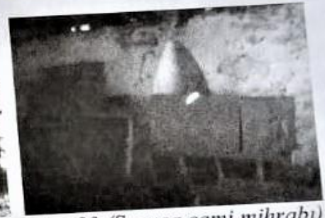
Resim-33 (Sırniça camii mihrabı)