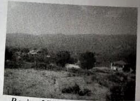
Resim-26 (Sevindikli köyü camii ve arkasında köy okulu)