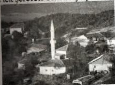
Resim-3 (Kızıdoğan köyü camii)

Kızıdoğan köyü camisinin minaresi 2010 yılında yaklaşık 26 metre yükseklikte ve tek şerefeli olarak yapılmıştır. Minare Valandovo'ya girişten gözükmemektedir.