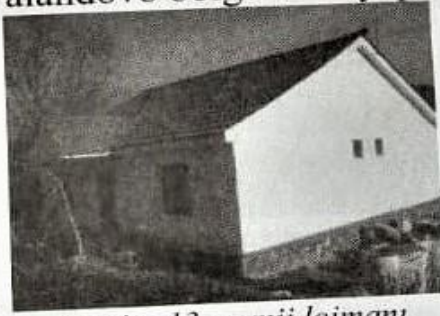
Resim-13 camii lojmanı