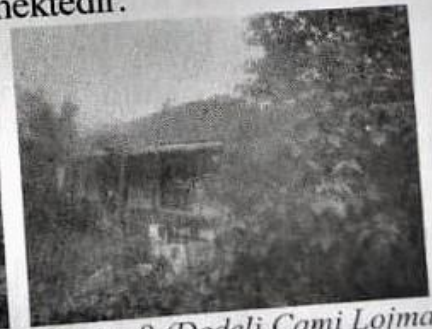
Resim-8 (Dedeli Cami Lojmanı)