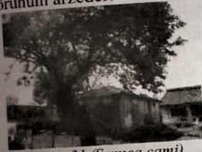
Resim-31 (Sırniça camii)

Sırniça köyü camisi çatısı ve duvarları ile hala ayaktadır. Ancak zamanla eskimiş durumda olan caminin kapıları kapalı tutulmaktadır. Kapının anahtarı yakındaki bir ailede mevcuttur. Caminin içerisine bazı eşyalar konarak depo olarak kullanılmaktadır. Caminin pencereleri örülerek kapatılmıştır. Caminin bahçesinde kible tarafında ve doğu tarafında tarihi iki çınar ağacı hala camiye beklercesine bir görünüm arzeder. Caminin minaresi yoktur.