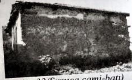
Resim-32 (Sırniça camii-batı)