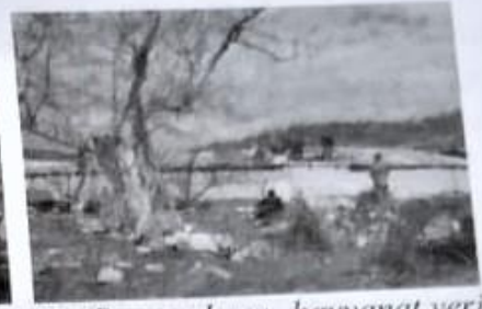
Resim-30 (Bayrambosu- hayvanat yeri)