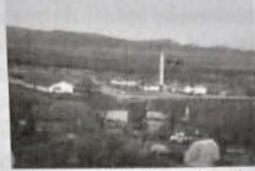
Resim-2 (Kalkova köyü)