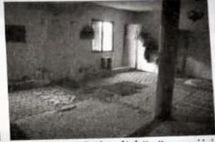
Resim-11 (Gökçeli köyü camii içi)