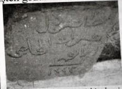
Resim-5 (Kızıdoğan camii kitabesi-2)

Caminin tarihi iki kitabesi vardır. Bir kitabe caminin giriş kapısının hemen üzerindedir. Kızıdoğan camisi kapısının üzerinde bulunan kitabede hadis-i şerif, ayet-i kerime, cami inşası bilgileri ve tarih vardır.