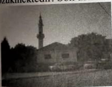
Resim-12 (Çalıklı köyü cami)

Çalıklı köyü cami köyün tam ortasında olup 1988 yıllarında tamamen yenilenerek yapılmıştır. Caminin son tadilat ve tezyinatı 2005 yıllarında yapılmıştır. Ev görünümündeki cami tek katlı olup iki bölümden oluşur. Kadınlar için ayrı bir yer tahsis edilmemiştir. Caminin tavanı biraz alçakcadır ve tavan ve iç duvarlar vernikli tahta döşemelerle süslenmiştir. Halıları yenilenmiş ve güzel bir ses sistemi takılmıştır. Yaklaşık 100 kişilik cemaat kapasitesi olan caminin bahçesi oldukça güzel düzenlenmiştir. Caminin 18 metrelik minaresi oldukça şirin gözükmektedir. Son asırda Valandovo bölgesinde yapılan ilk minaredir.