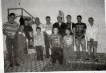
Resim-10 (Cuma namazı)