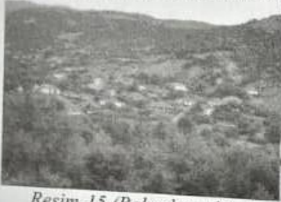
Resim-15 (Bahçebozu köyü)

Bahçebozu köyünün Osmanlı döneminden kalma eski camisi son dönemdeki depremde hasar görmüş ve yıkılmıştır. Köy ortasındaki bu caminin yerine yeni büyük bir cami inşa edilmektedir. 3 katlı yapılan caminin inşaatı henüz bitmemiştir. Caminin birinci katı şimdi geçici olarak faaliyet göstermektedir. Bahçebozu camii bittiğinde bölgenin en büyük ve kubbeli ilk camisi olacaktır. Caminin sıvaları yapılmış, kaba inşaatı bitmiş, kapı pencereleri takılmış ve çatısı tamamlanmış durumdadır. Caminin yapılışına Bahçebozu köyü cami hocası Enver Hoca öncülük yapmaktadır. Radoviş'ten Süleyman Yakup Hoca'nın da katkıları vardır. Camiye pek çok yerden yardımlar yapılmıştır. Camiinin inşaatında Ohri Tekke Camii din görevlisi İsmail Durma Hoca'nın büyük destekleri olmuştur. Caminin yanında minare yapılması da planlanmaktadır. Bahçebozu camisinde Hüsrev Hoca uzun yıllar görev yapar. Ayrıca İbrahim Hoca, Ali Hoca ve Selami Hoca burda imamlık yapar. Günümüzde Bahçebozu camiinde Enver Hoca hocalık yapmaktadır.