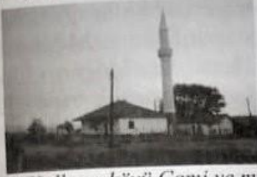
Resim-1 (Kalkova köyü Cami ve minaresi)