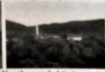
Kurthamzalı köyü camii