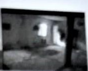
Gökçeli köyü Camii