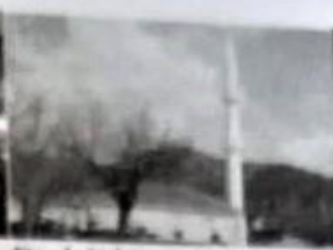
Dedeli köyü Camii