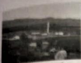
Kalkova köyü camii