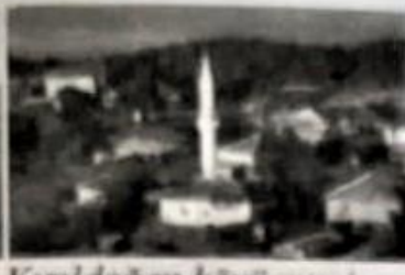
Kızıldoğan köyü camii