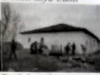
Durlobosu köyü camii