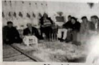
Kızıldoğan köyü- Mevlid