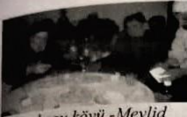
Bahçebozu köyü - Mevlid