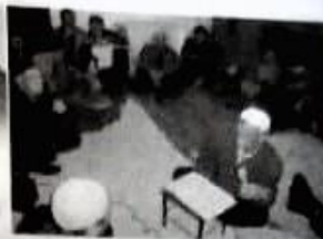
Çalıklı köyü- Mevlid

5. Cuma vaazlarının etkinleştirilmesi: Bağımsızlık sonrasında camilerde din görevlilerinin daha düzenli olması ve son yıllarda resmi atamaların yapılmasıyla birlikte Cuma namazlarında vaazlar ayrı bir önem kazanmaktadır. Türkiye'den gelen din görevlileri Dedeli ve Bahçebozu köyünde Cuma vaazları ve hutbeler, vaaz öncesi kuranı kerim okunması minare hoparlöründen tüm köyün duyacağı şekilde yapmaktadır. Vaazların bu şekilde yapılması toplumsal dini bilgi, duygu ve havanın oluşmasında çok önemli rol oynamaktadır. Vaaz ve hutbeler özellikle Cuma için camiye gelemeyen kadınlar tarafından ilgiyle takip edilmektedir.