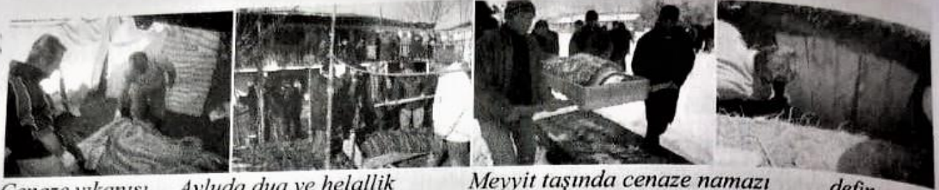
Cenaze yıkamaşı Avluda dua ve helallik Meyyit taşında cenaze namazı defin