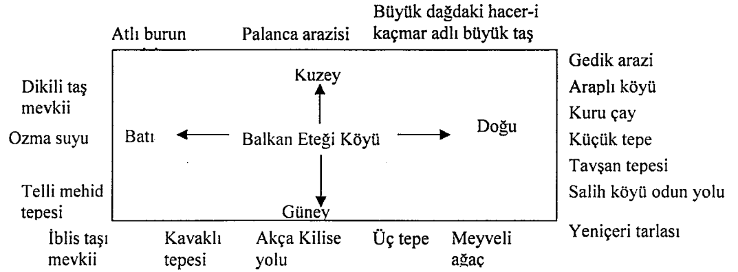
- Vakfa bağlı Balkan Eteği Köyü ve hudutları-