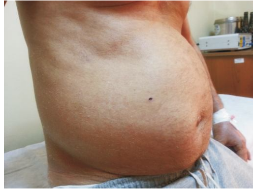
Şekil 1. Gövdede makülopapüler döküntü

kompleman seviyeleri normal bulundu. Akciğer grafisi ve abdominal ultrasonografi normaldi. Deri biyopsinin histopatolojik incelemesinde nekrotik epidermal keratinositler, ortokeratoz, irregular hiperplazi, vakuoler değişiklikler ve eozinofil içeren dermal infiltratla karakterize perivasküler dermatit bulguları saptandı. Ayrıca epidermotropizm gösteren ve yer yer atipi izlenimi veren lenfositler yanısıra, epitel altında perivasküler alanda lenfositler ve seyrek olarak eozinofil lökositler gözlemlendi (Şekil 2). Bu bulgularla AHS tanısı kondu. Karbamazepin tedavisi kesildikten sonra, hastaya intravenöz kortikosteroid (metil prednizolon 80 mg/gün) ve sistemik antihistaminik (setirizin 10 mg/gün) tedavisi başlandı. Kortikosteroid dozu tedricen 2 hafta içinde azaltılarak, 1 ay içinde tamamen kesildi. Bu tedavi sonrası hastanın döküntüsü, ateşi ve lenfadenopatileri geriledi. Normal olmayan laboratuvar test sonuçları progresif olarak düzeldi.