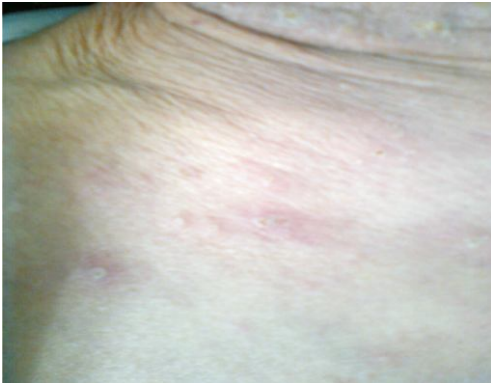
Şekil 1. Gövde ön yüzünde püstüler lezyonlar

Hematoloji bölümünde yatarak tedavi gören 83 yaşındaki erkek hasta, kliniğimize boyun, sırt ve kollarda başlayan kaşıntılı, kızamık, ucu iltihaplı sivilceler nedeniyle konsülte edildi. Hastanın, hematoloji bölümü tarafından 5 yıldır esansiyel trombositoz nedeniyle takip edildiği, primer hastalığına yönelik son üç aydır 1-2 gr/gün hidroksiüre tedavisini aldığı öğrenildi. Bu süre içinde başka bir ilaç kullanmadığı belirtildi. Hastanın dermatolojik muayenesinde boyunda, gövdenin üst kısımlarında ve kollarda eritemli zeminde folliküler olmayan püstülleri mevcuttu (Şekil 1). Biyokimyasal tetkiklerinde eozinofil ve platelet değerleri yüksekti. Püstüllerden yapılan bakteriyel kültürde üreme saptanmadı. Hastanın püstüllerinden alınan deri biyopsisinde intraepidermal püstül, dermiste nötrofil, eozinofil ve lenfosit infiltrasyonu izlendi (Şekil 2). Klinik ve histopatolojik bulgularına göre değerlendirilen hastaya püstüler ilaç erüpsiyonu tanısı konuldu. Tedavi olarak hastaya hidroksizin 25 mg günde 3 tablet başlanıp, hidroksiüre tedavisi kesildi ve kutanöz şikayetleri geriledi.