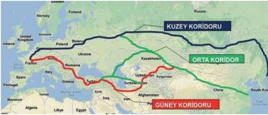
Harita 1: Modern İpek Yolu'nun Doğu-Batı Ulaşım Koridorları

Bu ilgi geçmişte olduğu gibi ticari ilişkilerle başlayıp turizm ve kültürel miras alanında da önem kazanmaya başlamıştır. Tarihi yol üzerinde yer alan ülkeler bağımsızlıklarını kazanıp bin bir gece masallarına konu olan kentler ve tarihi yolları onarıp yeniden kullanılabilir hale getirmişlerdir. Bu ve benzeri gelişmeler tarihin en iyi bilinen kara ve kentlerinin birer turizm markası olarak kullanılmasını gündeme getirmiştir. Bu nedenle Klasik Doğu İpek Yolundaki ticaret ve turizm alanındaki işbirlikleri günümüzde artarak devam etmektedir. İpek Yolu tarihi filmlerde ve seyahat medyalarında Orta Asya odaklı tasvirlerle Doğu İmajlı betimlenmiştir. Bu nedenle İpek Yolu turizmiyle ilgili bilgi ve faaliyetlerin odak noktasını, Çin'den başlayıp İstanbul'da sona eren ' Klasik İpek Yol ' oluşturmuştur. Modern turizm pazarlamasının da Batı sınırı İstanbul olan Klasik İpek Yolu üzerinde yoğunlaştığı bilinmektedir (UNWTO, Greece, 2018: 12). Bu tanımlamadan Türkiye'nin İpek Yolu Turizminde ne kadar avantajlı bir konumda olduğu görülebilir.