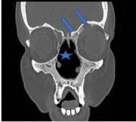
Resim 2: Çekilen koronal kesit paranasal tomografide nazal septumun totale yakın perfore olduğu gözlenmiştir, sol frontal sinüste tabanda destrüksiyona yol açan mukosel izlenmiştir.