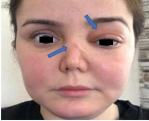
Resim 1: Sol gözde propitozis görünümü ve semer burun deformitesi