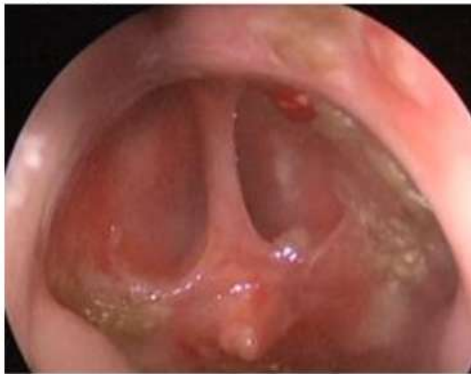
Resim 3: İntraoperatif endoskopik bakıda septumun totale yakın perfore olduğu gözlenmiştir.