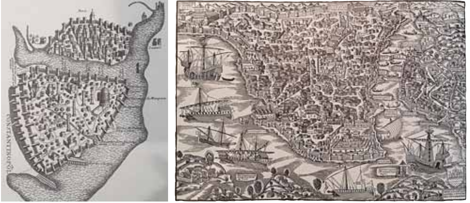
Şekil 3-4. İstanbul'un 1420 tarihli Buondelmonti tarafından yapılan resmi ile 1520 tarihli Vassore çizimi