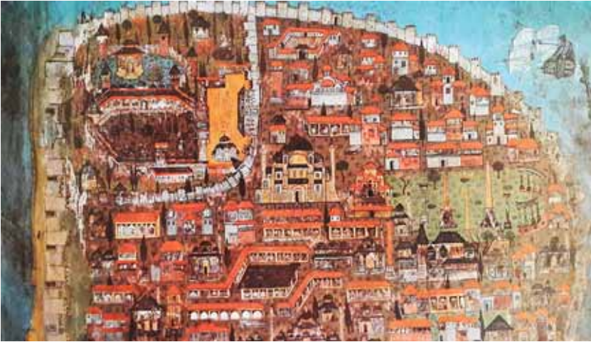
Şekil 5. İstanbul'un Matrakçı Nasuh tarafından yapılan resmi (Kostantiniye kısmı)