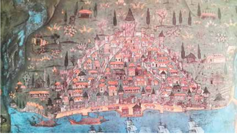
Şekil 6. İstanbul'un Matrakçı Nasuh tarafından yapılan resmi (Galata kısmı)